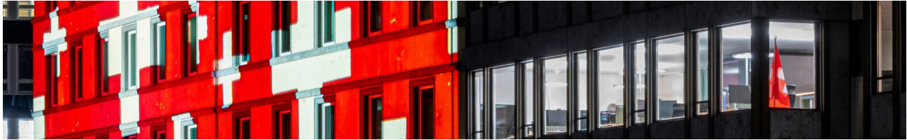
Beleuchtung am Hauptsitz der Maerki Baumann & Co. AG in Zürich vom Schweizer Lichtkünstler Gerry Hofstetter

Eine Bankbeziehung in der Schweiz bietet Anlegerinnen und Anlegern mit Wohnsitz Deutschland viele Vorteile. Die Zürcher Privatbank Maerki Baumann & Co. AG zeichnet sich durch ihre besonnene Anlagepolitik nach dem Grundsatz »Sicherheit vor Rendite« aus.