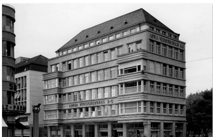
Erster Geschäftssitz bei Gründung: »Alpina-Haus« am Bleicherweg 10 in Zürich