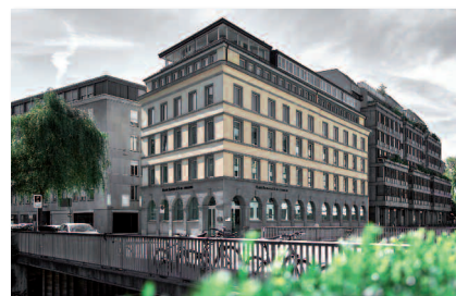
Heutiger Hauptsitz an der Dreikönigstrasse 6 in Zürich